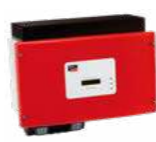
ou onduleur central SMA