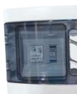
Coffret de protection AC Suivi de production ECU : En option