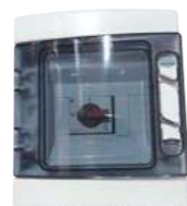
Coffret de protection DC